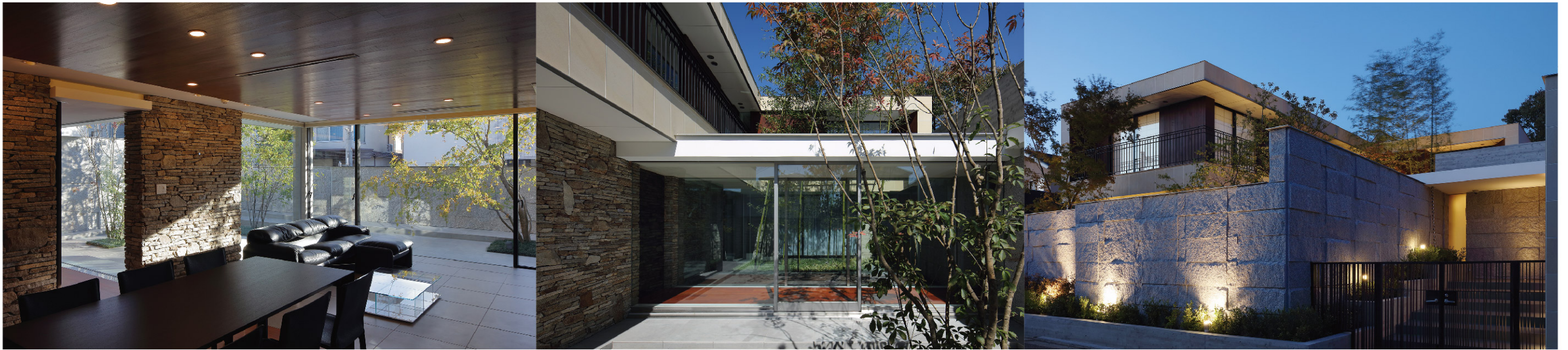
設計:澤村昌彦