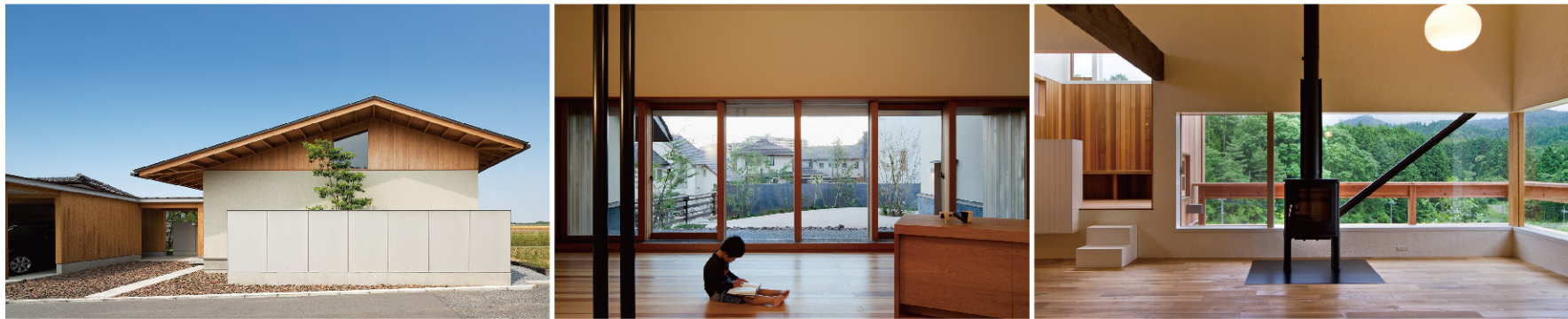
使用写真(左から) / 設計:吉武研二 / 設計:服部信康 / 設計:服部信康