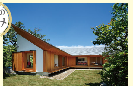
設計:河口佳介