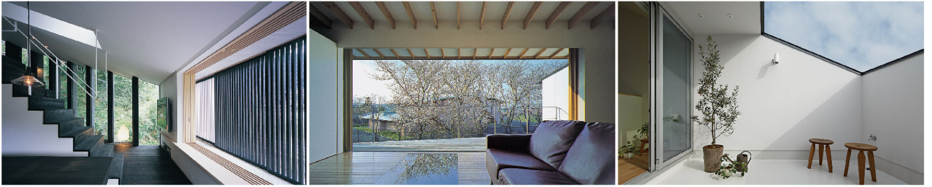
使用写真(左から) 設計:岸本和彦/設計:山田浩史/設計:河内真菜