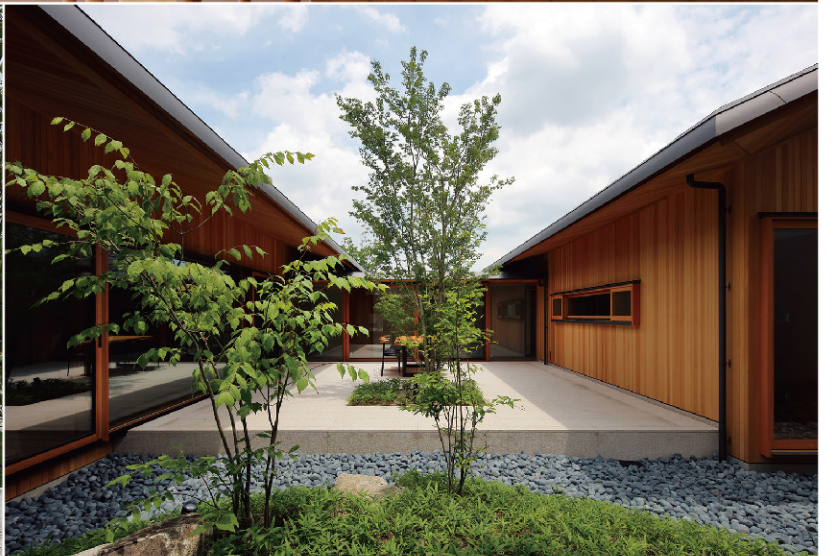
ASJ登録建築家作品 / 「桂坂の家」 設計:安原三部[安原三部建築設計事務所]