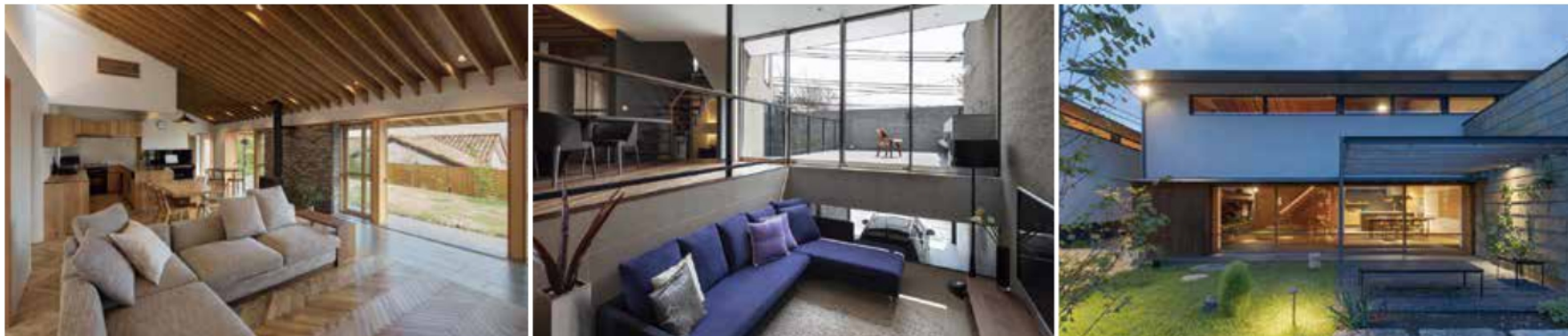
使用写真(左から) 設計:田中義彰/設計:岸研一/設計:加藤雅康