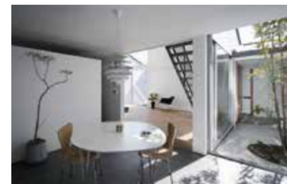
ASJ 宇多津スタジオ施工物件「丸亀の家」 設計:向阪一郎

これまで香川県内で施工した建築家住宅を、最新のお引渡し事例まで多数パネルで展示します。住まう方の意見を取り入れ、周りの景観まで考慮した家づくりは建築家ならではの。ぜひ参考にご覧ください。